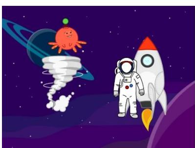
Tolle kleine Geschichten entstanden auf den iPads

Besuchen Sie unsere Homepage unter www.buecherei-beselich.de und lernen Sie die Bücherei und ihre Angebote näher kennen.