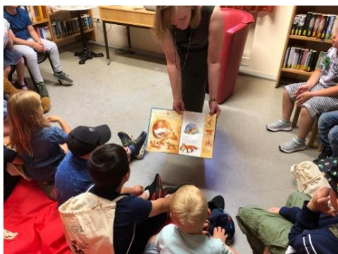
Bibfit wieder in der Bücherei