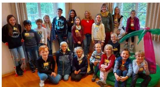
Abschlussfest zum Buchdurst 2022