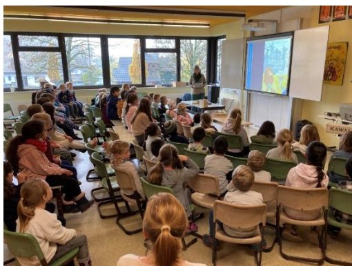
Bundesweiter Vorlesetag 2022