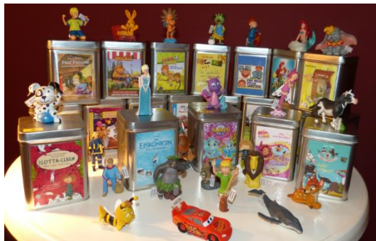
Tonies® waren 2020 der Ausleihrenner, daher wurden 35 neue angeschafft.

Nahezu alle Aktionen unserer Bücherei sind in 2020 ausgefallen. Stattgefunden haben: