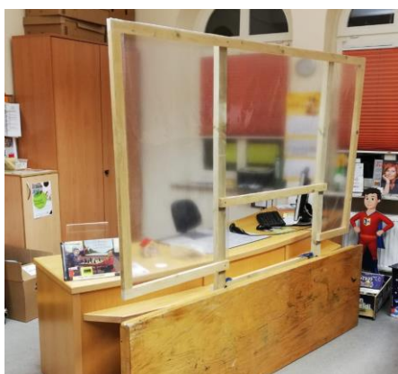
Zunächst als Provisorium gedachte Schutzwand