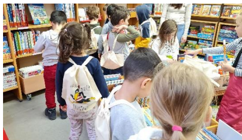
Bibfit-Kinder stöbern in der Bücherei

Und für die Kleinsten wurde der Vorleseadvent ins Leben gerufen, der vom Hessischen Literaturrat bezuschusst und der Firma Sternthaler gesponsert worden ist. Das Zuhören der Kids beim Vorlesen wurde belohnt. Die Prämien wurden erst beim Wintervorlesefest im neuen Jahr vergeben, da es zwischen den Jahren zu wenig Anmeldungen für das Fest gab.