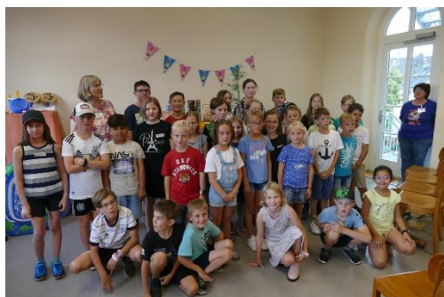
Gute gelaunte Kids beim Buchdurstabschlussfestes