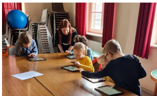
Spaß mit iPads in der Bücherei