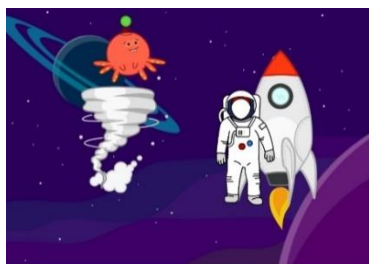
Tolle kleine Geschichten entstanden auf den iPads

Save the date: Dringen-Flohmarkt - 09. bis 13.10.2024 Room Escape - 18. bis 20.10.2024 Buchausstellung - 09. bis 10.11.2024