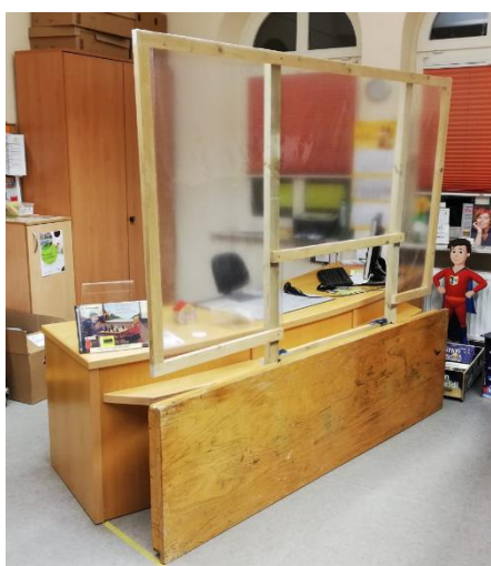
Zunächst als Provisorium gedachte Schutzwand