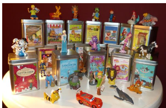
Tonies® auch 2021 der Ausleihrenner