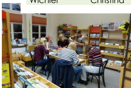
So war es 2021 leider nicht möglich!

durchgeführt werden kann. Oftmals ein Nervenspiel für unsere Ehrenamtlichen, die auch in Familie und Beruf in dieser Zeit besonderen Herausforderungen ausgesetzt waren.