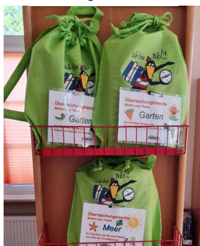
Ein Blick auf die Überraschungstaschen