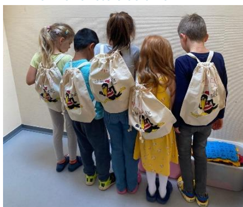
BibFit to go in der Kita